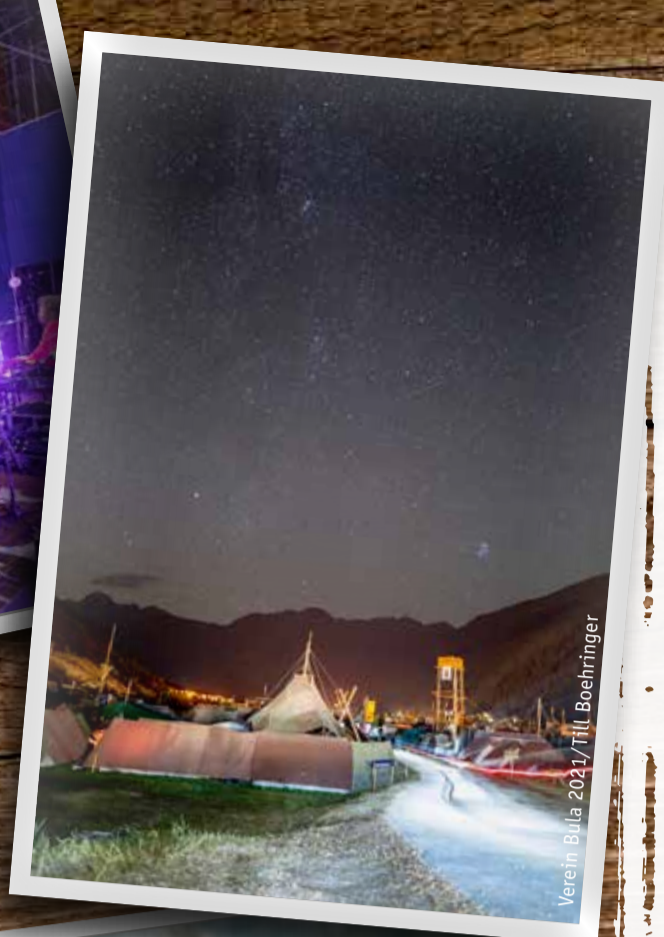
Verein Bula 2021/Till Boehringner