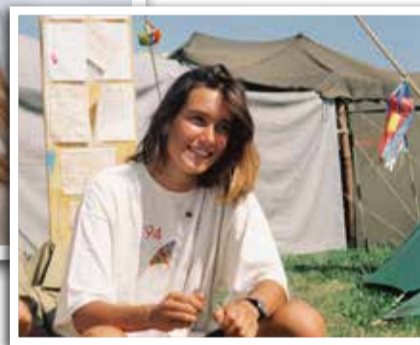
... et comme « Wuschel » au CaFé Cuntrast en 1994

En tant que Silver Scouts, toi et ton mari êtes toujours liés au scoutisme. Vos enfants font-ils aussi partie des scouts ?